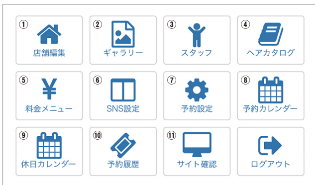
③編集できる項目 (管理画面TOP)