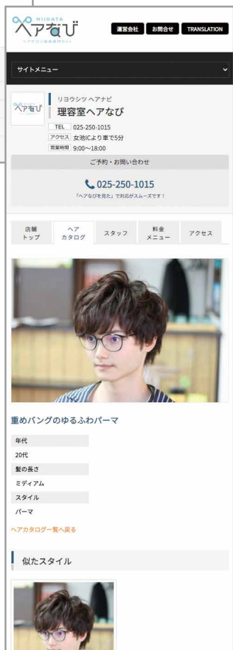
ヘアカタログ詳細